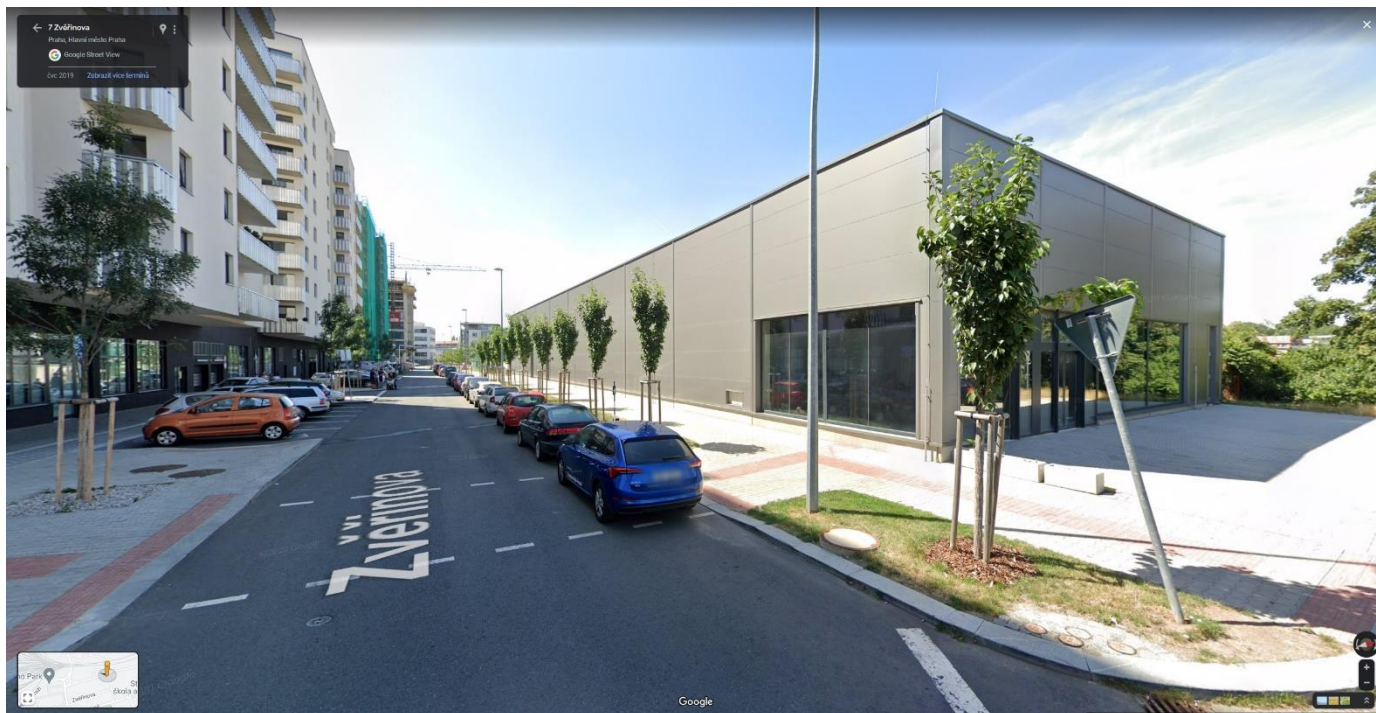
Foto: stávající obchodní novostavba ve Zvěřinově ulici