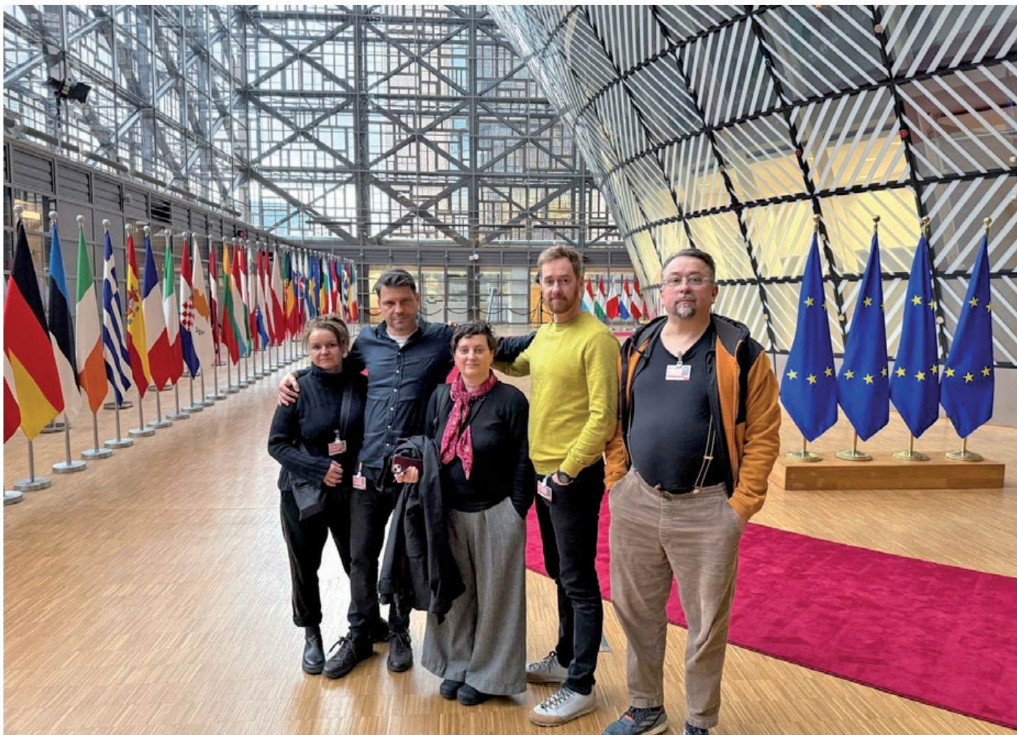
Tvůrci Kanceláře Blaník na divadelním zájezdu v Bruselu.