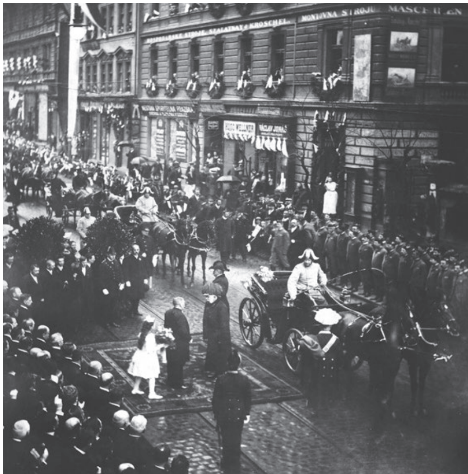
Císař František Josef I. u budovy Žižkovských lázní