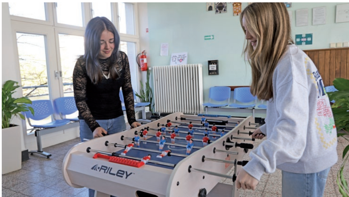
Žákyně 7. C hrají na chodbě školy fotbálek