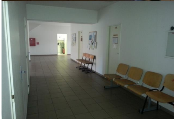
Vstupní schodiště a čekárna v prostorách OSPOD ÚMČ Praha 3