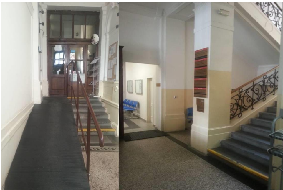
Vrátnice s bezbariérovým vstupem a vstupní hala s orientační tabulí

Vnitřní prostory úřadu: výtah a vstupní schodiště do prostor OSPOD, včetně čekárny. Prostory jsou bezbariérové, nekuřácké, dosažitelné pomocí výtahu.