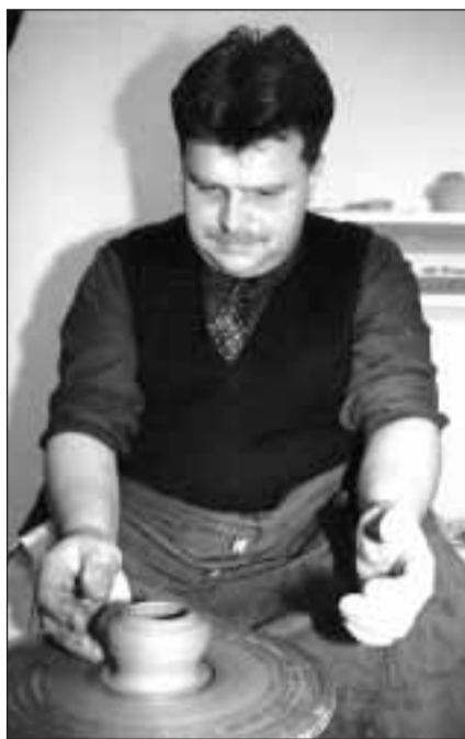
Kdo by odolal nabídce usednout za hrnčířský kruh a vdechnout beztvář hmotě duši

KONTAKT: Trojka, Prokopova 100/16, Praha 3, tel.: 227 83 181, 227 81 355.