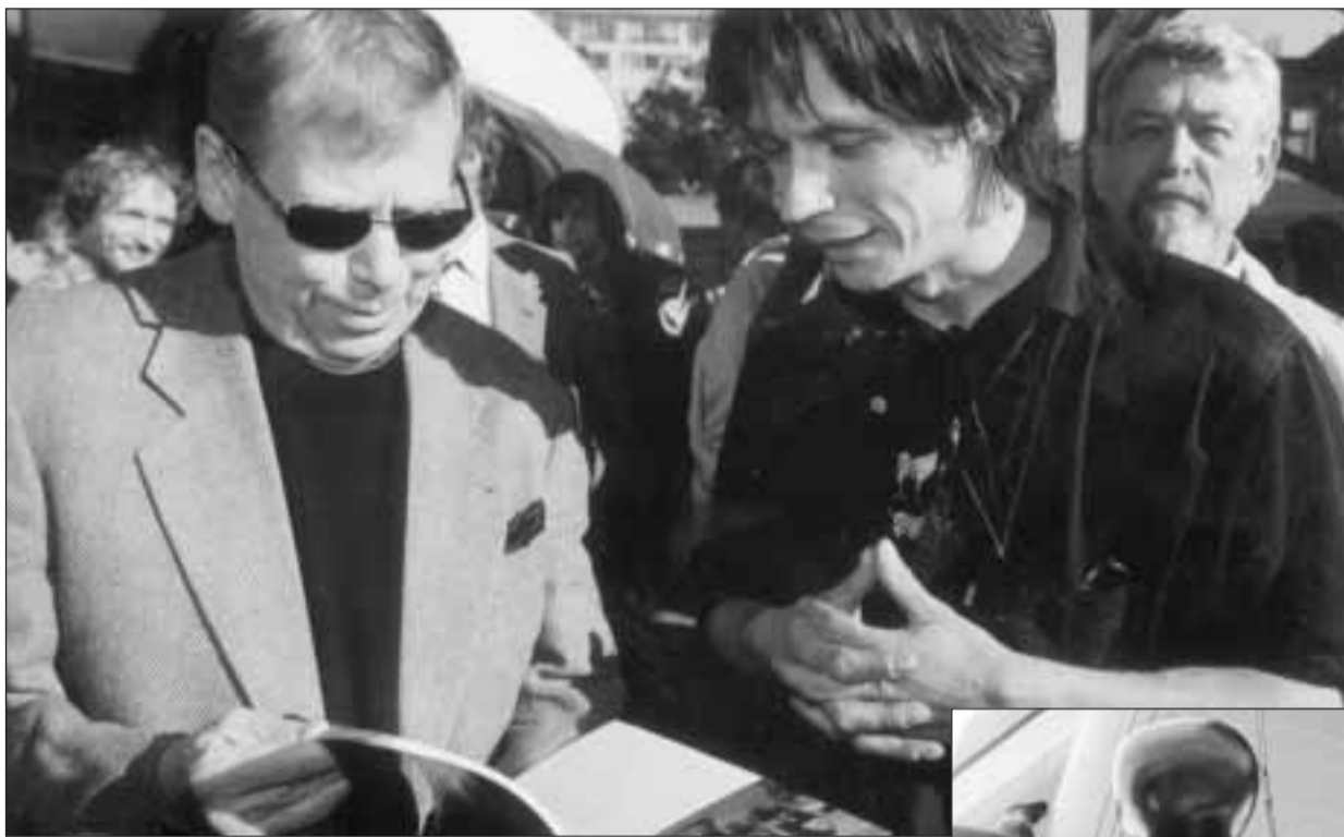
Václav Havel se s Davidem Černým usmívá nad fotografií „krácejícího“ trabantu

Naše nejvýraznější dominanta, televizní vysílač, se již opravdu nedá přehlédnout. Proč? Něco se na ní stále děje. Při pohledu z dálky je to takové mravenčí hemžení čehosi černého, při pohledu zblízka vás rozesmějí olbřímí mimina, která vesele skotačí nahoru dolů.