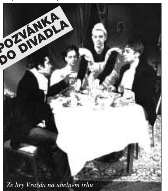
Ze hry Vražda na uhelném trhu