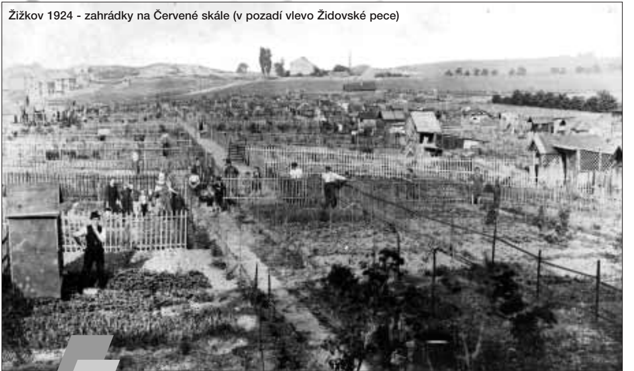
Žižkov 1924 - zahrádky na Červené skále (v pozadí vlevo Židovské pece)