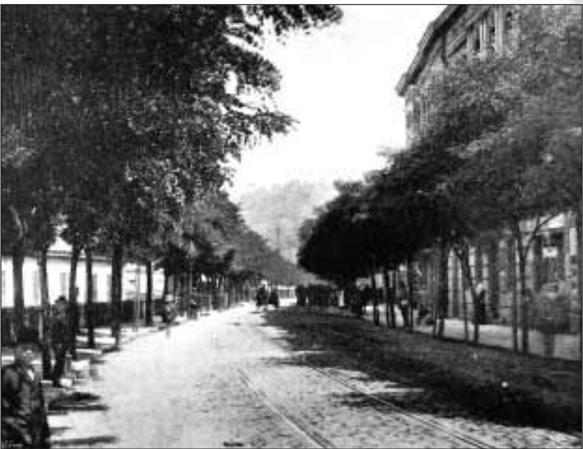
Bývalá Husova třída (dnes Husovská)

Finanční náklady 9 104 000 Kč - doba realizace rok 2006