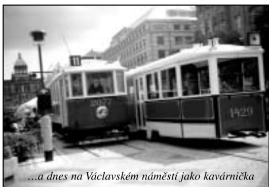
...a dnes na Václavském náměstí jako kavárnička

Barikáda na Želivského z tramvajové soupravy č. 2077 + 710 linky číslo 9 ve dnech květnového povstání – pohled z Basilejského náměstí směrem k Ohradě