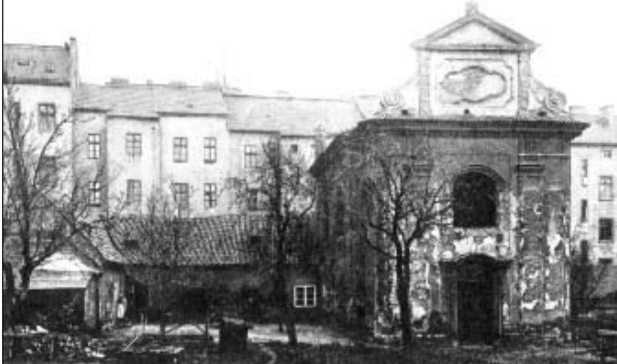
Kostel Povýšení sv. Kříže ještě s farním křídlem - rok 1912