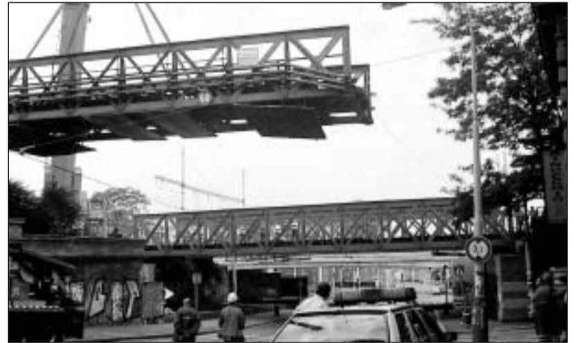
Snímání prvního starého mostu nad Seifertovou ulicí