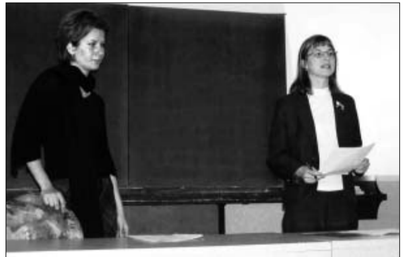
Návštěvníci byli velmi překvapeni, jak velký kus práce studenti odvedli - své závěry prezentovali s velkým zaujetím

Na veřejnou prezentaci prací z jednosemestrálního kurzu pozvala 21. 5. Katedra cestovního ruchu VŠE. Studenti se v kurzu zaměřili na analýzu a následně doporučení zapojení Žižkova do cestovního ruchu hl. m. Prahy.