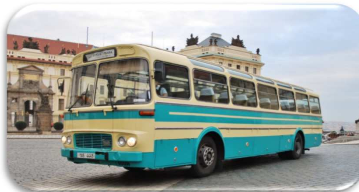
Karosa ŠD 11 Tourist