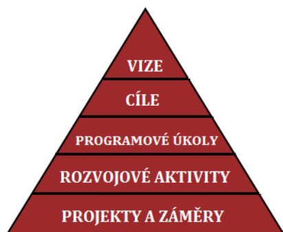
Obr. 1: Struktura strategického plánu pro orientaci v Akčním plánu

Jednotlivé úrovně jsou definovány ve Strategickém plánu rozvoje města následovně: