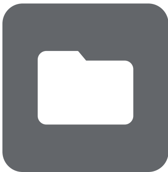
foto 1 (1)