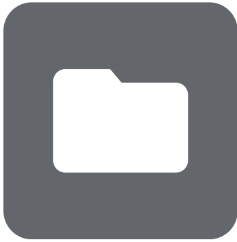
foto 2 (1)