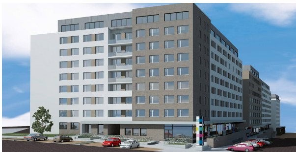
Roháčova 46, 48 a Ostromečská 7 a 9

Na výše uvedené investice chce radnice hledat prostředky i mimo rozpočet městské části. Rada městské části Praha 3 již schválila žádost na MHMP o spolufinancování výstavby z rezervy hlavního města Prahy na školku v Bukové ulici, rekonstrukci oken ZŠ náměstí Jiřího z Poděbrad a na revitalizaci parku U Kněžské louky.